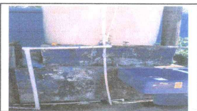
Foto 3: CONSTRUCCION DE UNA TORRE DE CEMENTO PARA ROTOPLAS Y SUS INSTALACIONES