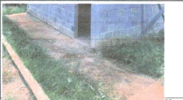
Foto 5: CERAMICO EN EL CORREDOR Y PASAMANOS DEL AULA DE PREPRIMARIA