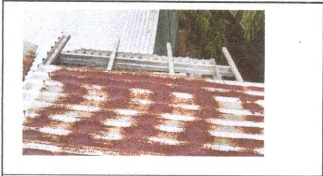
foto 1 sustitución de lamina