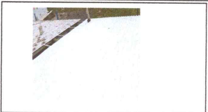
foto 2 Sustitución de lamina