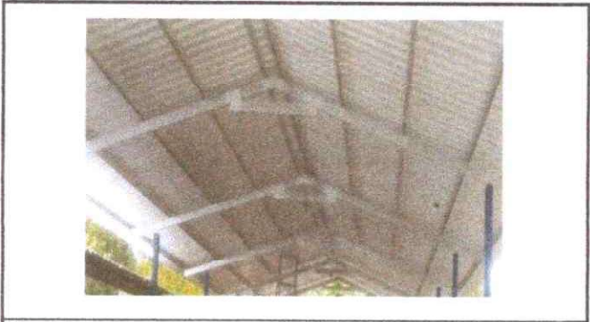
Foto 3 Sustitución de soporte de madera por metal