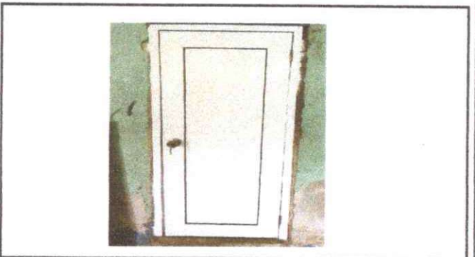
Foto 4 Elaboración de puertas PVC para baños