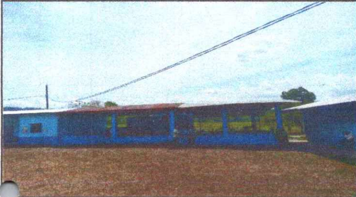
Sustitución de estructura de soporte de madera, por metal