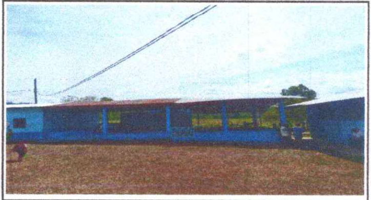
Sustitución de lámina, por lamina troquelada aluzinc calibre 26