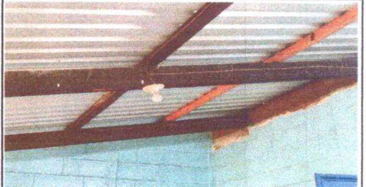
Reparación de cableado eléctrico.