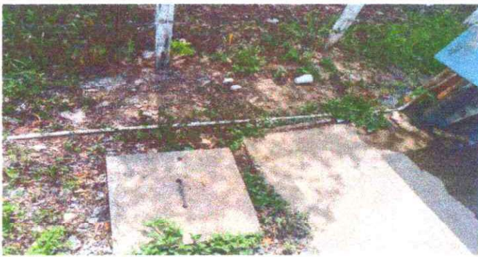
Sustitución de tubería lineal principal