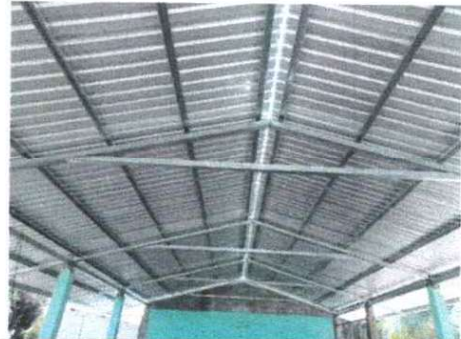
FOTO 2: SUSTITUCION DE ESTRUCTURA DE SOPORTE DE MADERA, POR METAL