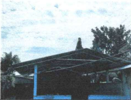
FOTO 1; SUSTITUCION DE LAMINA, POR LAMINA TROQUELADA ALUZINC CALIBRE 26