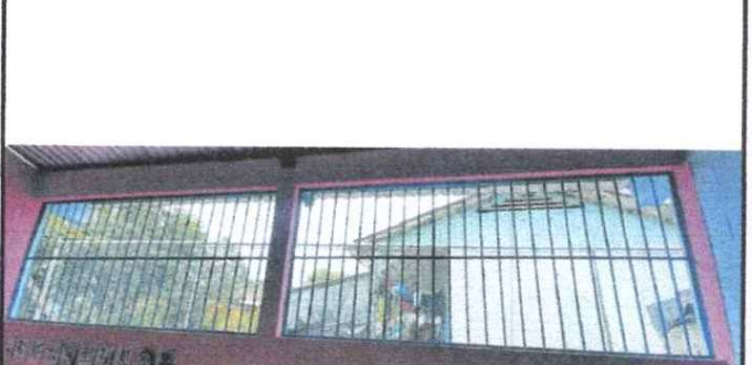
FOTO 6: FABRICACION E INSTALACION DE BALCONES DE HIERRO EN VENTANA

Observación: Si es necesario se pueden agregar hojas adicionales y actualizar el número de hojas.