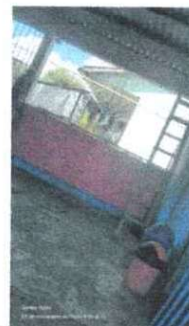
FOTO 6: FABRICACION E INSTALACION DE BALCONES DE HIERRO EN VENTANA

Observación: Si es necesario se pueden agregar hojas adicionales y actualizar el número de hojas.