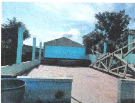
FOTO 1: SUSTITUCION DE LAMINA, POR LAMINA TROQUELADA ALUZINC CALIBRE 26