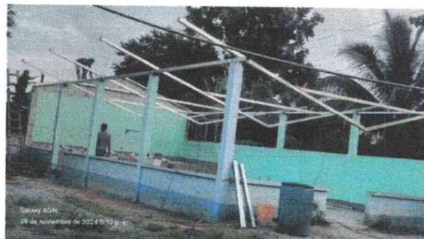
FOTO 2: SUSTITUCION DE ESTRUCTURA DE SOPORTE DE MADERA, POR METAL