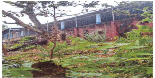
FOTO 2 SUSTITUCION DE ESTRUCTURA DE MADERA POR METALICA EN TECHO Y PINTURA EN MUROS INTERIOR Y EXTERIOR