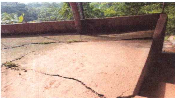
FOTO 5 SUSTITUCION DE TORTA DE CEMENTO