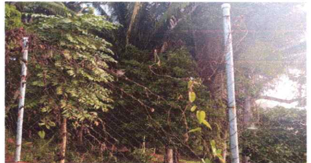
Foto 4 REPARACION DE MALLA GALVANIZADA