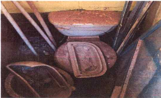
FOTO 3 SUSTITUCION DE INODORO