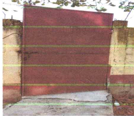
REMOZAMIENTO DE PORTON DE INGRESO.