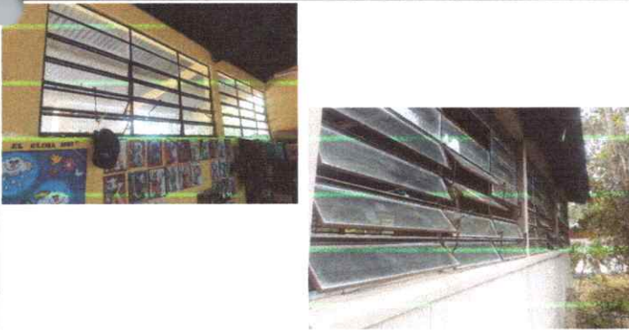
SUSTITUCION VENTANAS DE MADERA POR PVC

Observación: Si es necesario se pueden agregar hojas adicionales y actualizar el número de hojas.