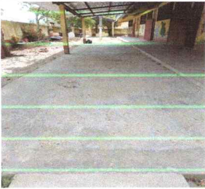
SUSTITUCION PISO TORTA DE GALERA USOS MULTIPLES