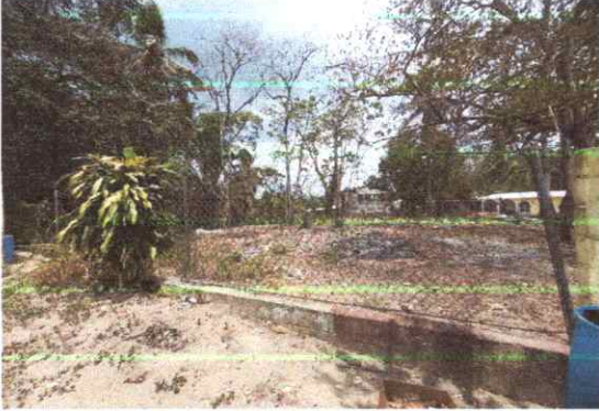
REMOZAMIENTO MURO PERIMETRAL