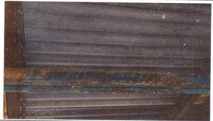
2. SUSTITUCION DE ESTRUCTURA DE METAL POR METAL.