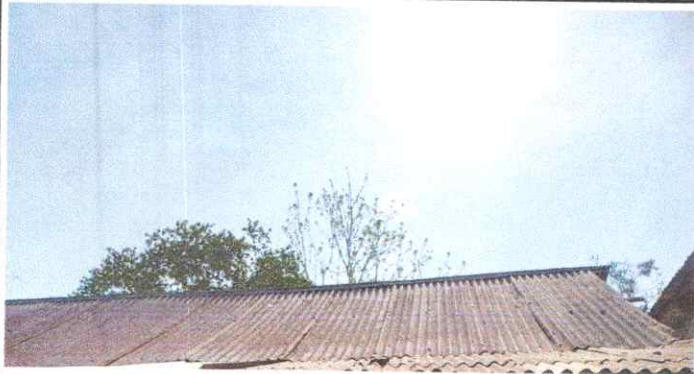
1. CUBIERTA DE TECHO CON LAMINA TROQUELADA ALUZINC CAL. 26