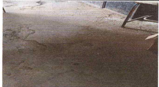
6. SUSTITUCION DE PISO CERAMICO

Observación: Si es necesario se pueden agregar hojas adicionales y actualizar el número de hojas.