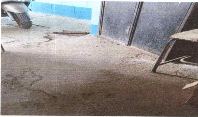
3. SUSTITUCION DE PUERTAS