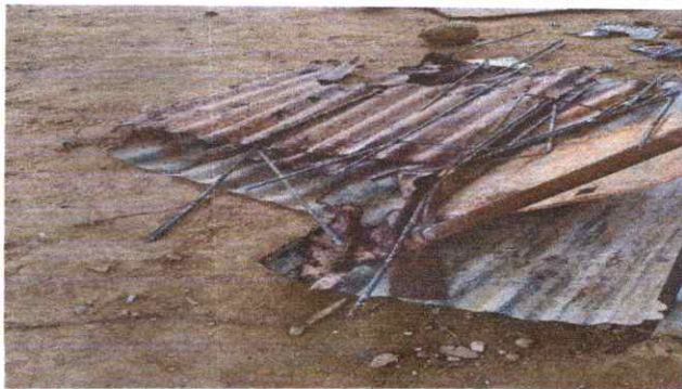
5. SUSTITUCION DE TORTA DE PISO DE CONCRETO