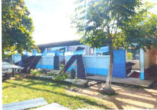
Foto1: Sustrucción de lámina, por lámina troquelada aluzinc calibre 26