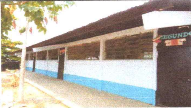
Foto 1: SUSTITUCIÓN DE LÁMINA, POR LAMINA TROQUELADA ALUZINC CALIBRE 26