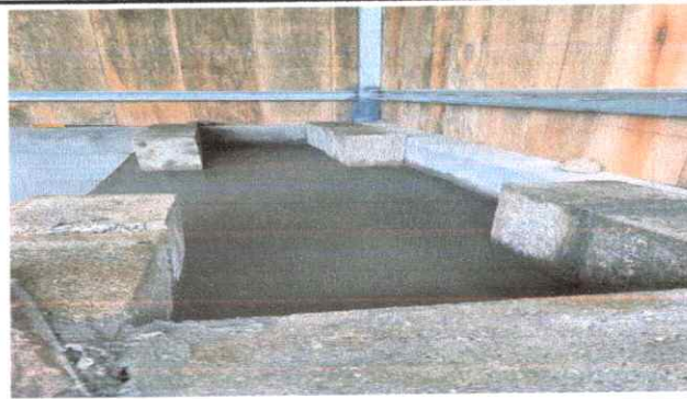
Foto 4: SUSTITUCION DE ESTUFA RURAL, CON CHIMENEA Y PLANCHA DE METAL