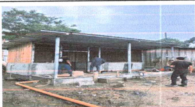
Foto 5: SUSTITUCION DE LAMINA POR LAMINA TROQUELADA ALUXINZ CALIBRE 26