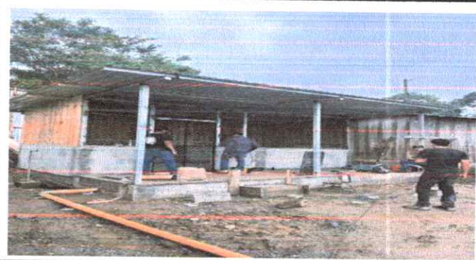
FOTO 9: SUSTITUCIÓN DE TUBERIA PCV LINEA DE AGUAS NEGRAS Y ZANJEADO

Observación: Si es necesario se pueden agregar hojas adicionales y actualizar el número de hojas.