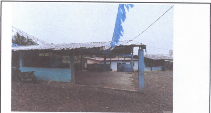
Foto No.4 Piso de concreto rustico con ollos y techo de lamina en mal estado