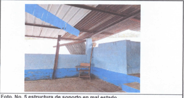
Foto No. 5 estructura de soporte en mal estado