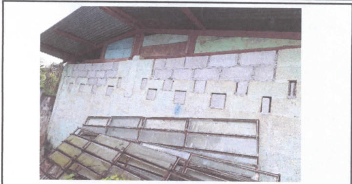
Foto No. 2 pared en mal estado parte trasera sin repello