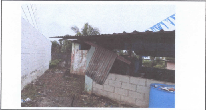
Foto No.3 Pared parte de enfrente sin repello