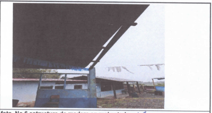
foto No.6 estructura de madera en mal estado.

Observación: Si es necesario se pueden agregar hojas adicionales y actualizar el número de hojas.