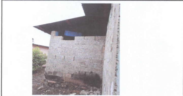
Foto No.1 Pared en mal estado.