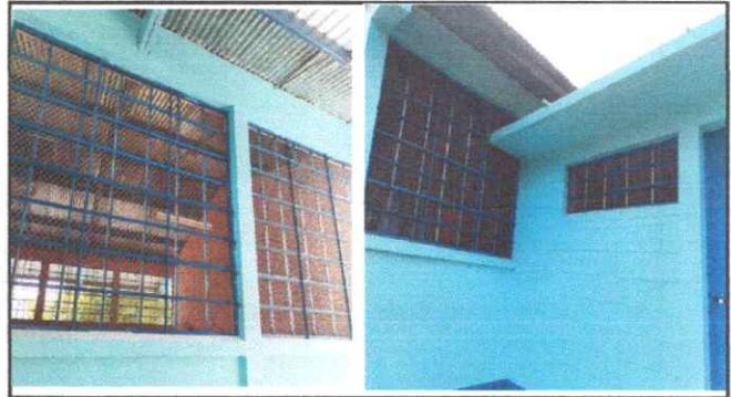
Foto 2: SUSTITUCION DE PERCIANAS EN MAL ESTADO, POR BALCONES CON MAYA GALVANIZADA TERMINADAS