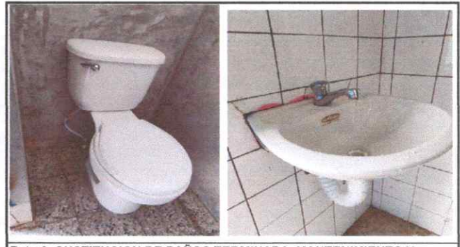
Foto 6: SUSTITUCION DE BAÑOS TERMINADA, MANTENIMIENTO Y REPACION DE LAVAMANOS TERMINADA

Observación: Si es necesario se pueden agregar hojas adicionales y actualizar el número de hojas.