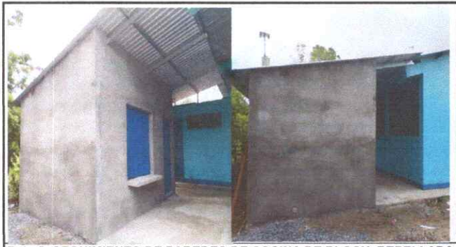
Foto 5: SEGUIMIENTO DE PAREDES DE COCINA DE BLOCK, REPELLADA CON PISO DE GRANITO TERMINADA