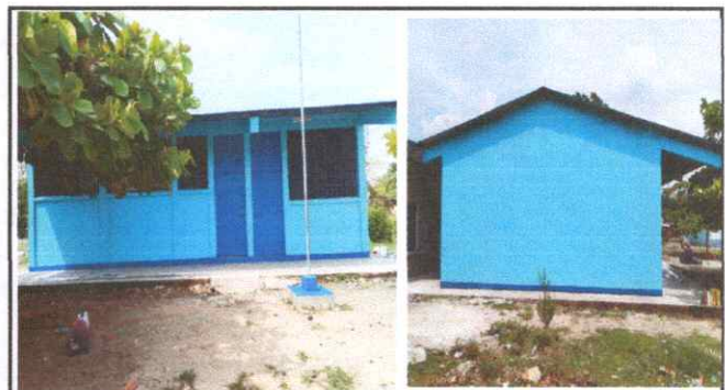
Foto 4: PINTURA DE EXTERIOR DEL CENTRO Y TECHO DEL MISMO TERMINADA