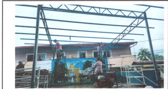
Foto1: CONSTRUCCIÓN DE GALERA DEL ESENARIO