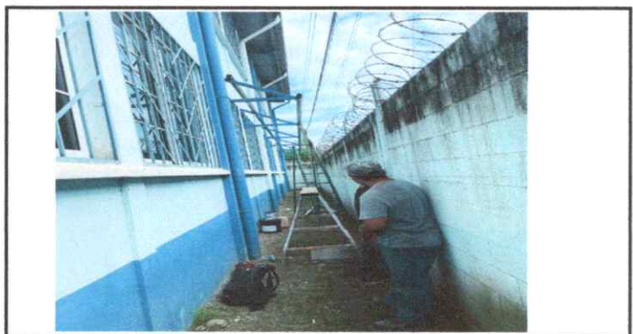
CONSTRUCCION DE ALERO PARA LAS AULAS

Observación: Si es necesario se pueden agregar hojas adicionales y actualizar el número de hojas.