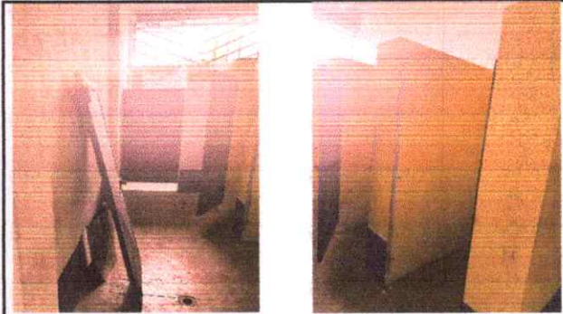
2. REPARACION DE PUERTAS DE LOS BAÑOS