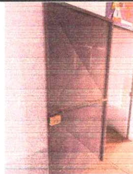
4. REPARACIÓN DE PUERTAS DE AULAS.