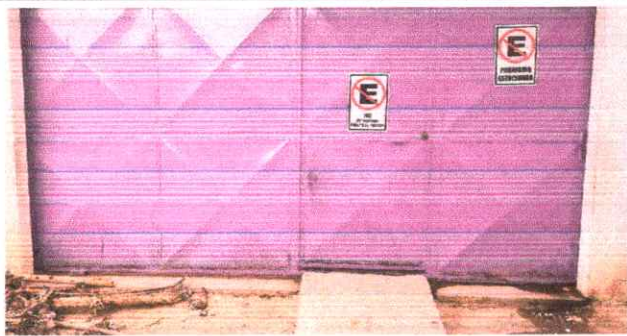
3. REPARACION DEL PORTON PRNCIPAL DE LA ESCUELA.