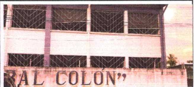
6. CONTRUCCIÓN DE ALERO PARA LAS AULAS

Observación: Si es necesario se pueden agregar hojas adicionales y actualizar el número de hojas.