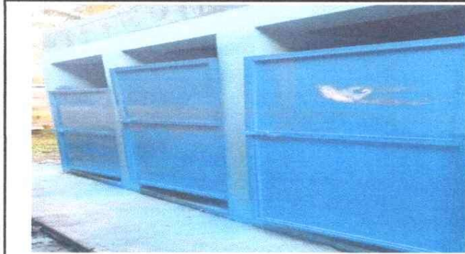
Foto1: SUSTITUCIÓN DE PUERTAS