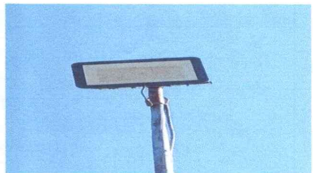
Foto 4: SUSTITUCIÓN DE LAMPARAS POR LAMPARAS INTERPERIE DE 1000 WATS