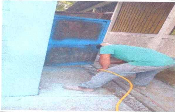
Foto1: SUSTITUCIÓN DE PUERTAS