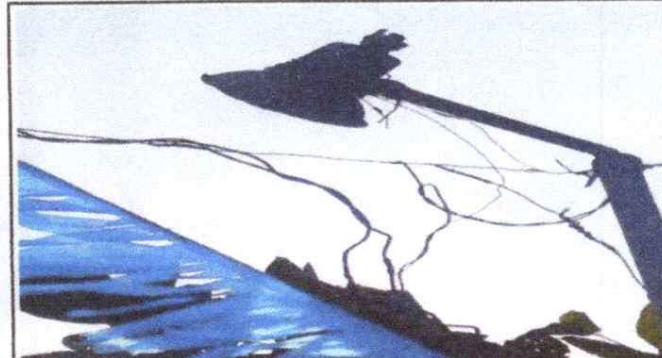
Foto 4: SUSTITUCIÓN DE LAMPARAS POR LAMPARAS INTERPERIE DE 1000 WATS