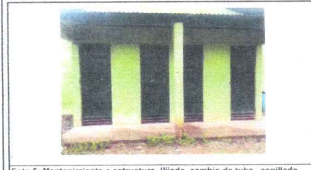
Foto 5: Mantenimiento a estructura (lijado, cambio de tubo, cepillado, sujeciones, aplicación de pintura)