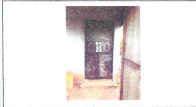
Foto1: Sustrucción de puerta