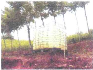
Foto 7 Sustitución de deposito de agua

Observación: Si es necesario se pueden agregar hojas adicionales y actualizar el número de hojas