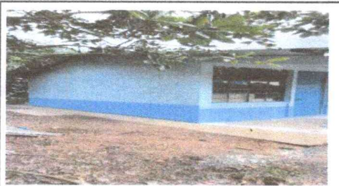
Foto 9 Pintura de muros exterior e interior