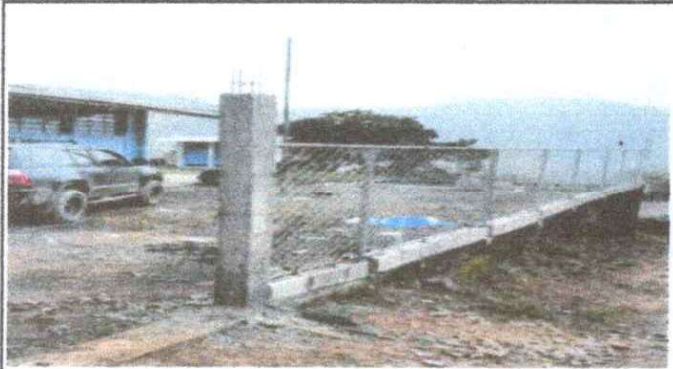
Foto 7 Reparacion de muro perimetral de block con tubo hg, malla galvanizada, solera y columnas