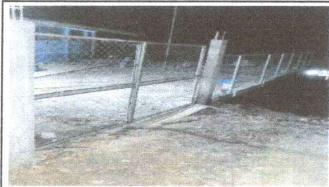
Foto 8 Sustitucion de porton de madera por tubo hg y malla galvanizada.