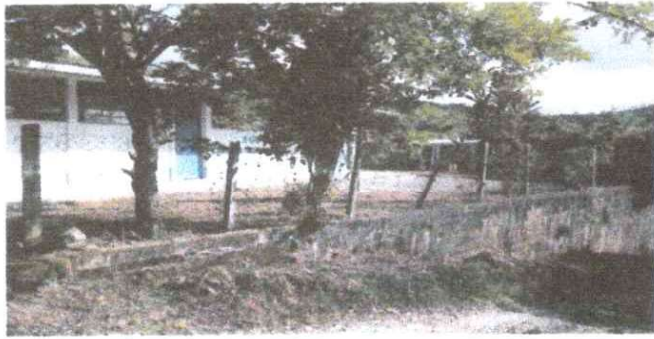
Foto1 Reparacion de muro perimetral de block con tubo hg, malla galvanizada, solera y columnas .