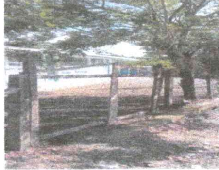
Foto 2 Sustitucion de porton de madera por tubo hg y malla galvanizada