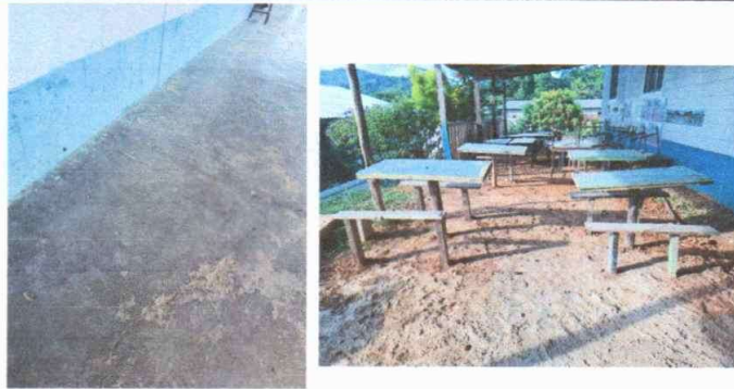
Foto1: AREA ECREATIVA: TORTA DE CEMENTO Y 12 MESAS CON SUS BANCAS DE CEMENTO.