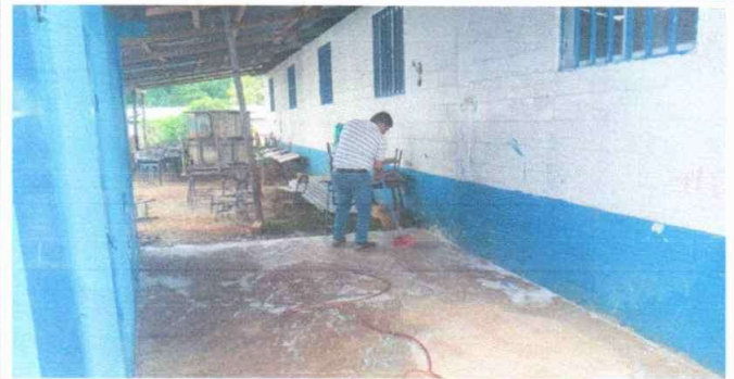
Foto 4: Frente de los baños: REMOZAMIENTO DE PILA CON TANQUE + TUBERIA DE AGUA, DRENAJE, CHORRO Y LLAVE DE PASO

Observación: Si es necesario se pueden agregar hojas adicionales y actualizar el número de hojas.