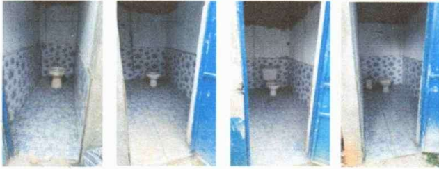
Foto 3: BAÑOS: REMOZAMIENTO E INSTALACION DE BAÑOS + TUBERIA DE DRENAJE Y AGUA.