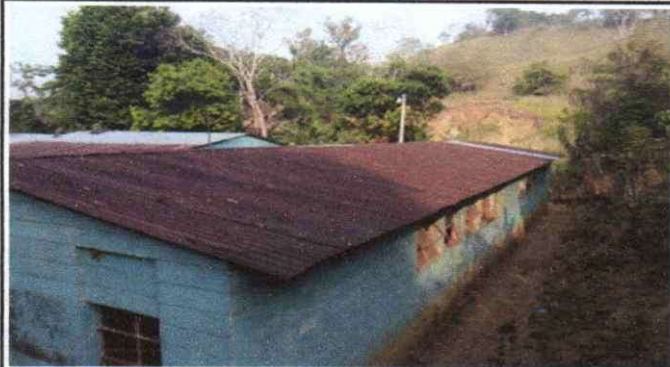
Foto1: Sustitución de lámina, por lámina troquelada aluzinc calibre 26