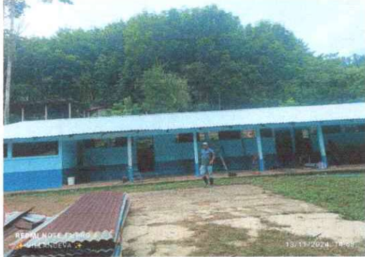
Foto 1: Sustrucción de lámina, por lámina troquelada aluzinc calibre 26