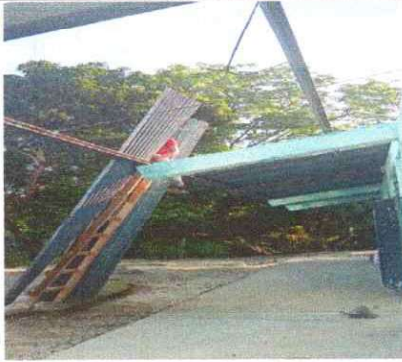
Foto1: SUSTITUCIÓN DE LÁMINA Y ESTRUCTURA METALICA