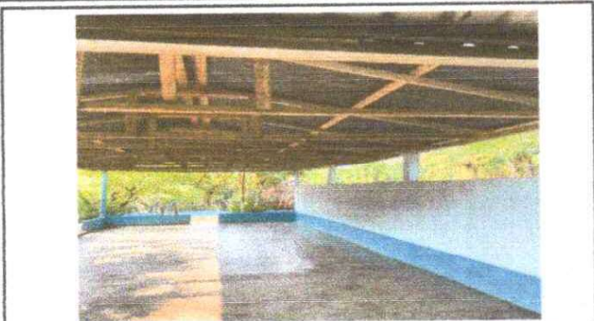
Foto1: Sustitución de lámina, por lámina troquelada aluzinc calibre 26