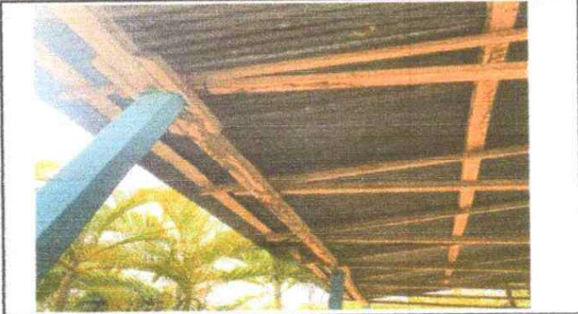
Foto 2: Sustitución de estructura de soporte de madera, por metal