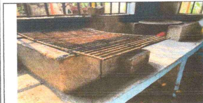
Foto 5: Sustitución de estufa rural (completa) incluye chimenea y plancha de merral