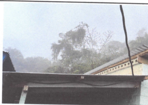
Elevacion de estructura para unir laminas de ambos lados -

Observación: Si es necesario se pueden agregar hojas adicionales y actualizar el número de hojas.