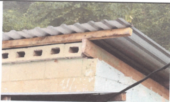
Sustitucion de estructura de madera por metal.