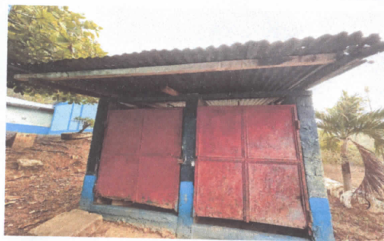
Sustitucion de puertas de metal.