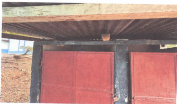
Cambio de estructura de madera por metal y lamina-