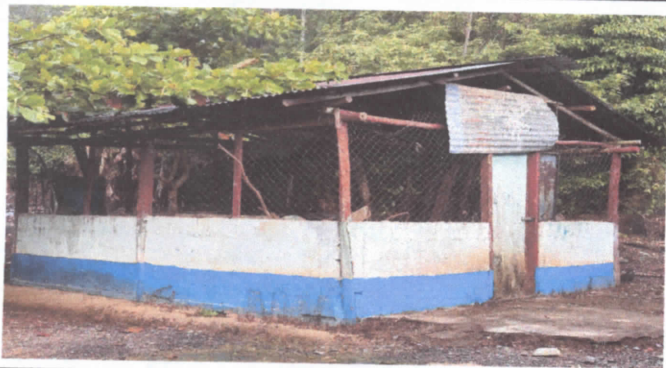
Reparación de cocina, estructura del techo.