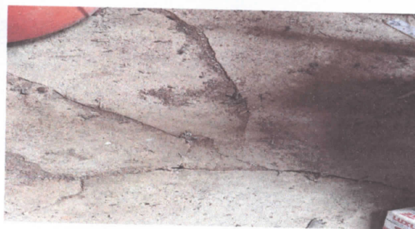
Reparacion piso de la cocina.