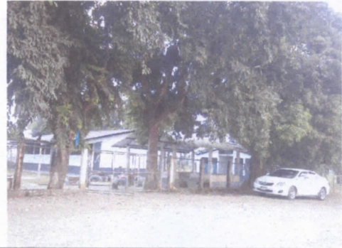
REPARACION E MURO PERIMETRAL DE BLOCK