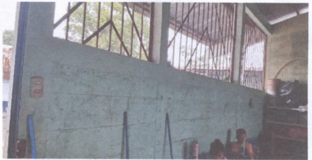
SUSTITUCION DE PLAFONERAS- SUSTITUCION DE INTERRUPTORES SIMPLES- SUSTITUCION DE INTERRUPTORES DOBLES- SUSTITUCION DE FLIPONES- SUSTITUCION DE TABLERO DE FLIPONES- REPARACION