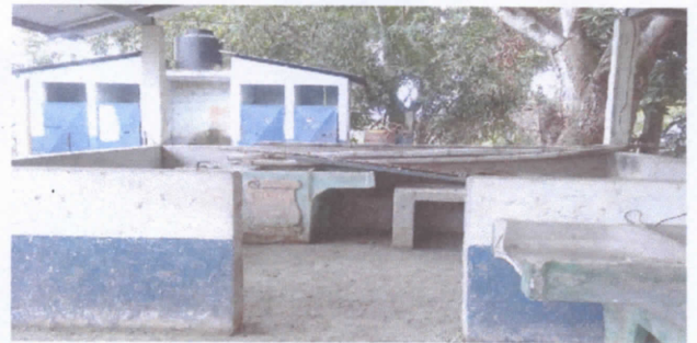
SUSTITUCION DE BALCONES DE METAL- SUSTITUCION DE PUERTA- REPARACION DE PISO TORTA DE CONCRETO- SUSTITUCION DE PLANCHA DE METAL DE 3 HORNILLAS

Observación: Si es necesario se pueden agregar hojas adicionales y actualizar el número de hojas.