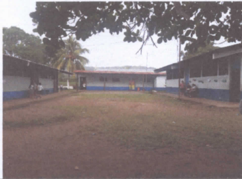
SUSTITUCION DE PUERTAS EN AULAS