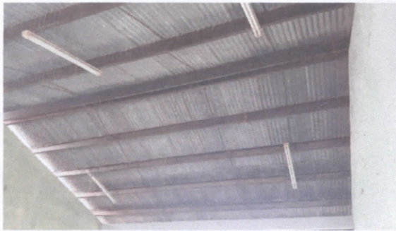
SUSTITUCION DE FOCOS AHORRADORES - SUSTITUCION DE DUCTO ELECTRICO MAS ACCESORIOS