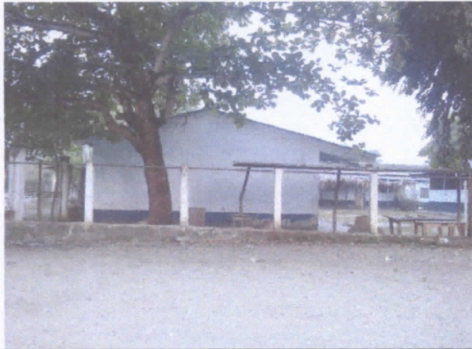
REPARACION DE MURO PERIMETRAL DE BLOCK