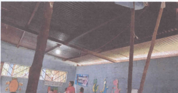
PINTURA EN MUROS EXTERIORES E INTERIORES