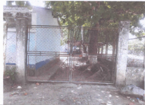
SUSITUCION DE PORTON DE METAL