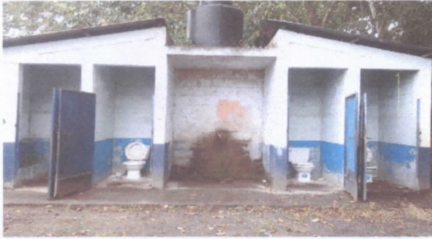
SUSTITUCION DE PUERTAS EN SERVICIOS SANITARIOS ' SUSTITUCION DE LAMINA, POR LAMINA TROQUELADA ALUZINC CALIBRE 26