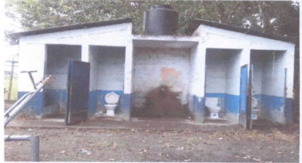
SUSTITUCION DE INODOROS - LIMPIEZA DE FOSA SEPTICA - SUSTITUCION DE DEPOSITO DE AGUA 1700 LT. - SUSTITUCION DE BOMBA DE AGUA