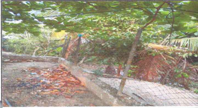
Foto1: REPARACIÓN DE MURO PERIMETRAL DE BLOCK