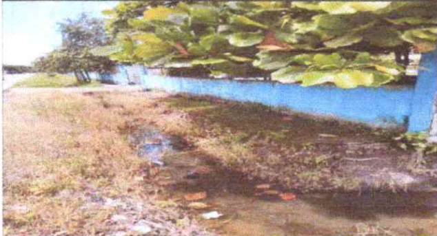
Foto 1: REPARACION DE MURO PERIMETRAL DE BLOCK TUBO HG Y MAYA GALVANIZADA CON SOLERAS INTERMEDIAS Y COLUMNAS