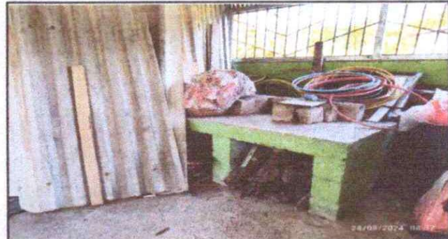
Foto 4: SUSTITUCION DE ESTUFA RURAL CON CHIMENEA Y PLANCHA DE METAL