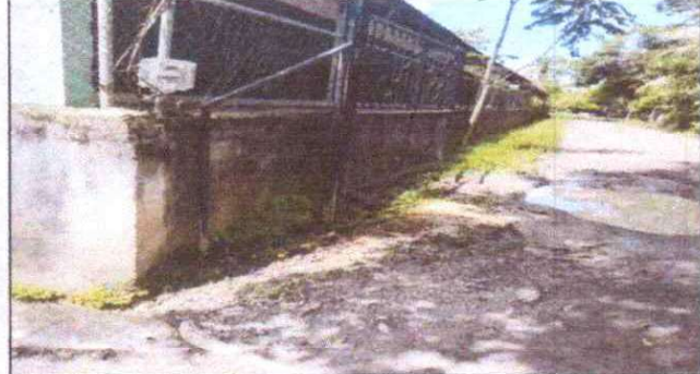
Foto 2: REPARACION DE MURO PERIMETRAL DE BLOCK TUBO HG Y MAYA GALVANIZADA CON SOLERAS INTERMEDIAS Y COLUMNAS