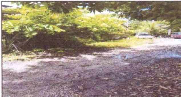
Foto 3: REPARACION DE MURO PERIMETRAL DE BLOCK TUBO HG Y MAYA GALVANIZADA CON SOLERAS INTERMEDIAS Y COLUMNAS