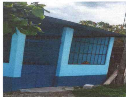
Reparación de Cocina

Observación: Si es necesario se pueden agregar hojas adicionales y actualizar el número de hojas.