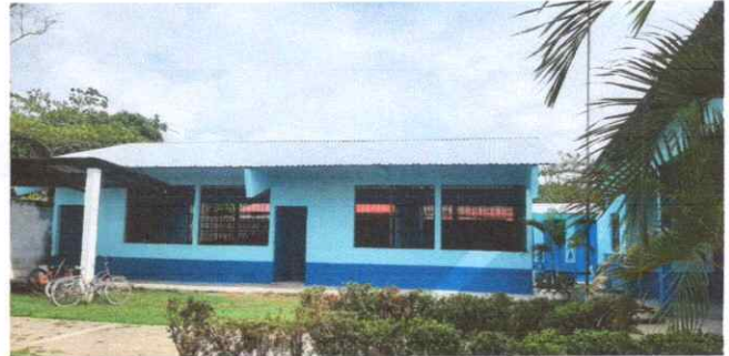
Sustitucion de Lámina troquelada calibre 26' y capotes