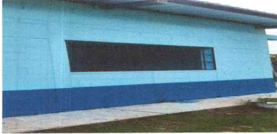
Sustitución de Lámina, por lamina troquelada Calibre 26'