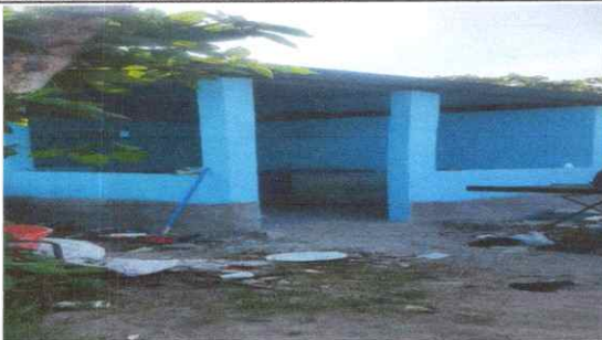
Pintura en Cubetas para muros exteriores e interiores