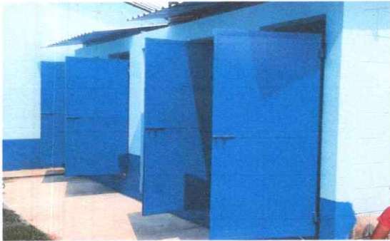
Reparación de Puertas de Metal