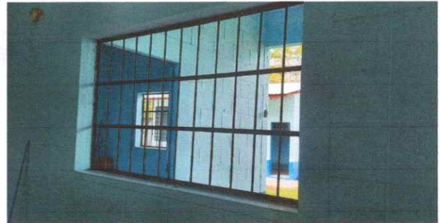
Sustitucion de balcones de metal de ventana