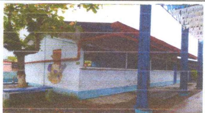
Foto 2. Parte de enfrente de las aulas que se necesita levantar el techo.