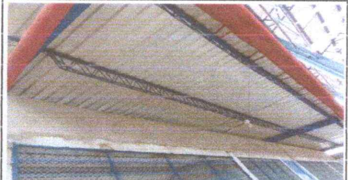
Foto 4. Nuevo techo de las aulas