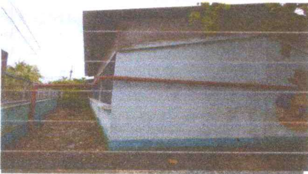
Foto 3. Parte de atrás de las aulas.