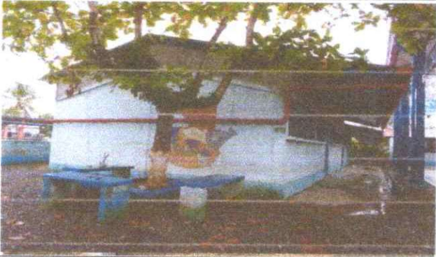
Foto 1. Un costado de las aulas que se reparó el techo, porque se inundan con agua de lluvia y posteriormente se levantará el piso.