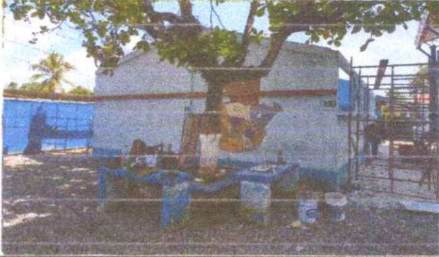
Foto 1. Un costado de las aulas que se están reparando