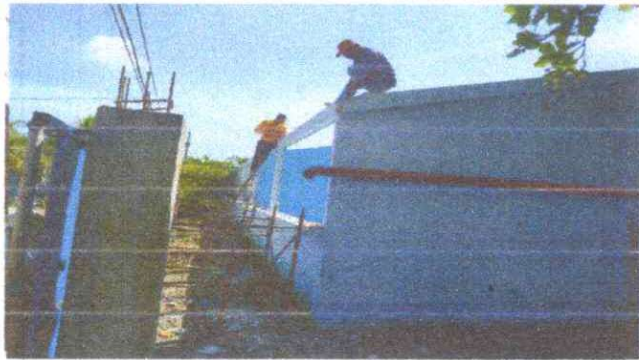
Foto 3. Parte de atrás de las aulas