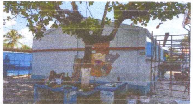
Foto 2. Parte de enfrente de las aulas