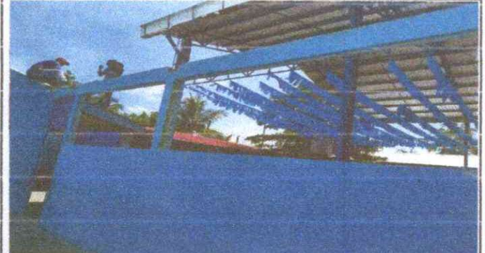
Foto 4. techo de las aulas en reparación