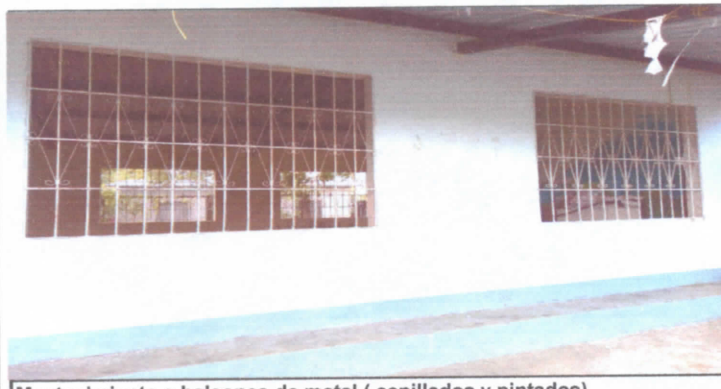
Mantenimiento a balcones de metal ( cepillados y pintados). 5