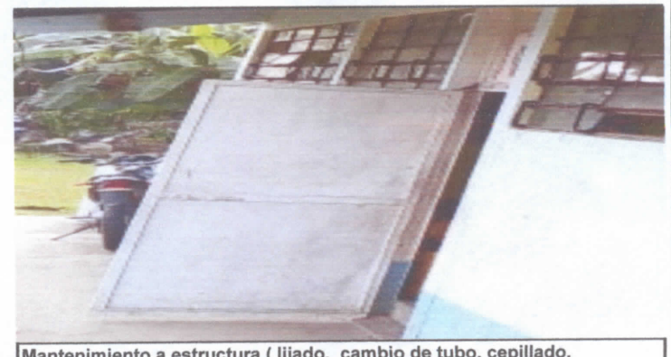
Mantenimiento a estructura ( lijado, cambio de tubo, cepillado, sujeciones, aplicación de pintura) 6

Observación: Si es necesario se pueden agregar hojas adicionales y actualizar el número de hojas.