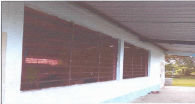
Sustitución de Estructura de Metal en Ventanas.