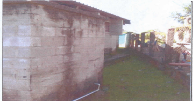
Sustitución de Depósito de agua, Reconstrucción de bases de cemento con parrilla metálica y deposito de agua nuevo.