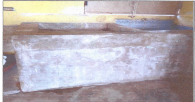
Reparación de azulejo en mueble de cocina