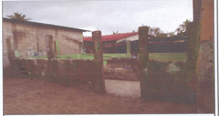
Reparación y repello de paredes 2