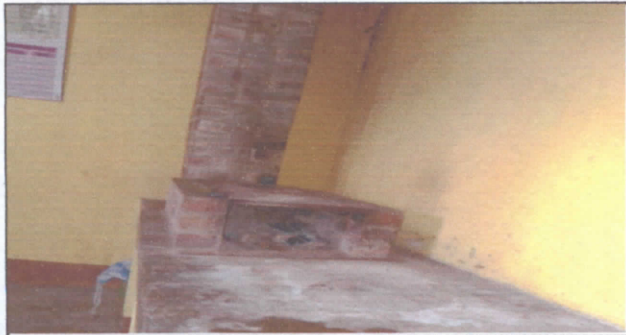
Mantenimiento de estufa rural/ se cambiaria plancha por deterioro y reparación de hornilla general.