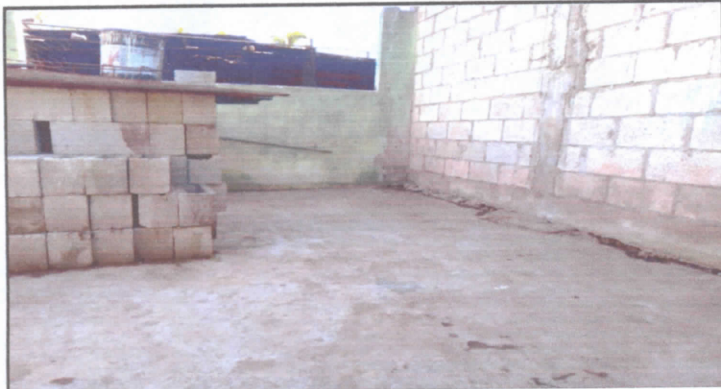
Sustitución de piso de torta de concreto. 3