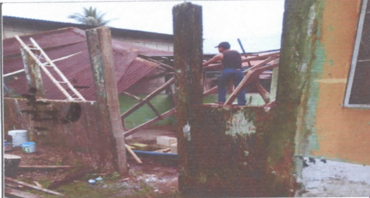
Cubierta de Lámina y Estructura de Techo, es decir se reparará estructura y techado. 1