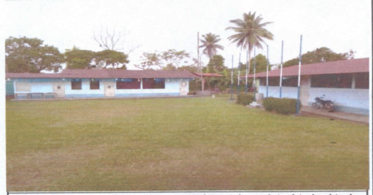
Mantenimiento a estructura de soporte de metal, se pintará todo el techo. 4