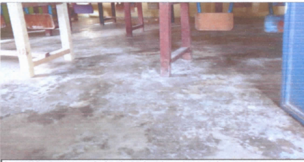
Sustitución de piso cerámico ( por deterioro de torta de cemento en centro de computación).