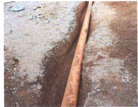
6. REPARACION DE RED DE DRENAJE Y RED DE AGUA POTABLE

Observación: Si es necesario se pueden agregar hojas adicionales y actualizar el número de hojas.