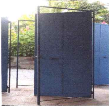
3. PUERTAS DE METAL