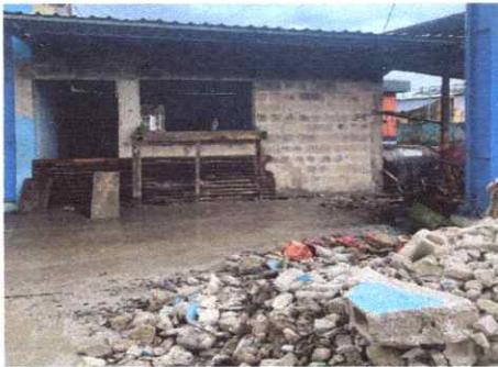
9. REPARACION Y REPELLO DE REPELLO Y CERNIDO DE PAREDES (CUANDO APLIQUE)

Observación: Si es necesario se pueden agregar hojas adicionales y actualizar el número de hojas.