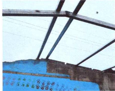
2. ESTRUCTURA DE TECHO