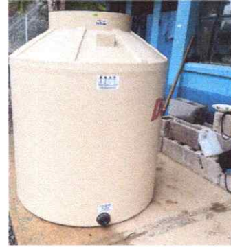
8. REPARACION Y MANTENIMIENTO DE SISTEMAS/DEPOSITOS DE AGUA