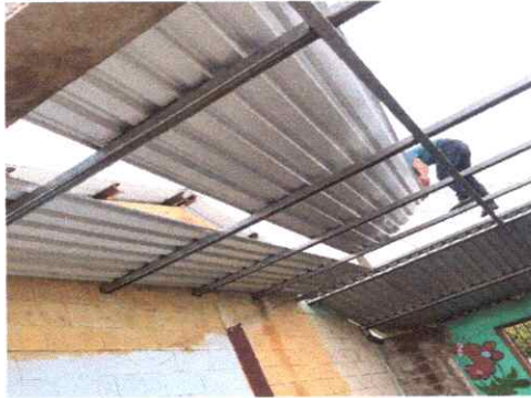
1. CUBIERTA DE TECHO