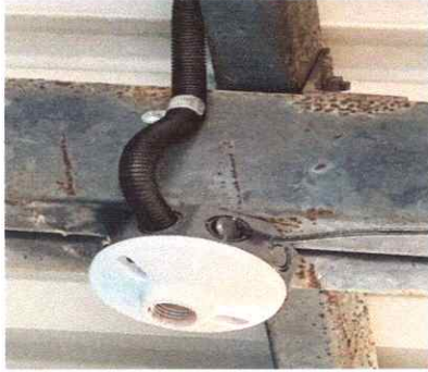
7. REPARACION SISTEMA ELECTRICO