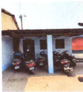
9. REPARACION Y REPELLO DE REPELLO Y CERNIDO DE PAREDES (CUANDO APLIQUE)

Observación: Si es necesario se pueden agregar hojas adicionales y actualizar el número de hojas.