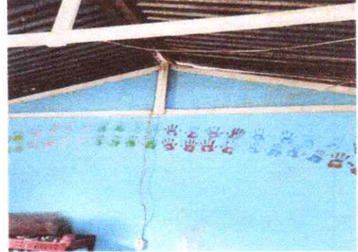
2. ESTRUCTURA DE TECHO