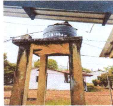
8. REPARACION Y MANTENIMIENTO DE SISTERNAS/DEPOSITOS DE AGUA