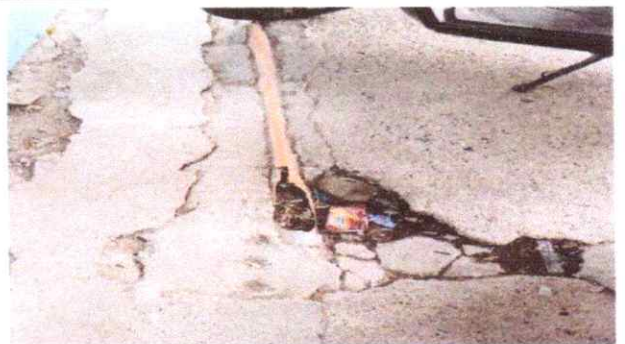
6. REPARACION DE RED DE DRENAJE Y RED DE AGUA POTABLE

Observación: Si es necesario se pueden agregar hojas adicionales y actualizar el número de hojas.