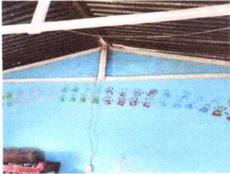
1. CUBIERTA DE TECHO