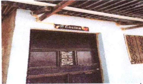
3. PUERTAS DE METAL