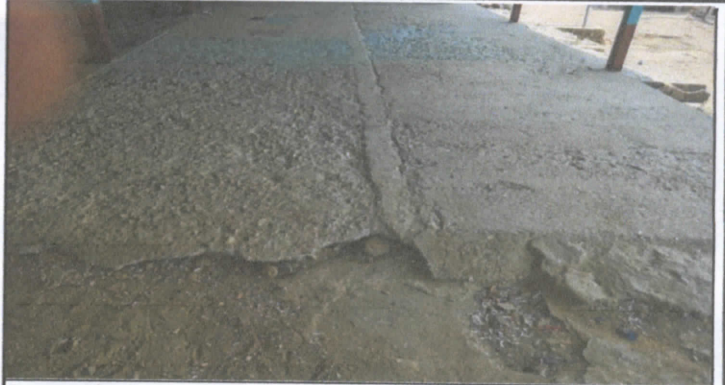
Reparación de torta de concreto