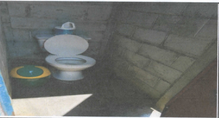
Sustitución de Inodoro