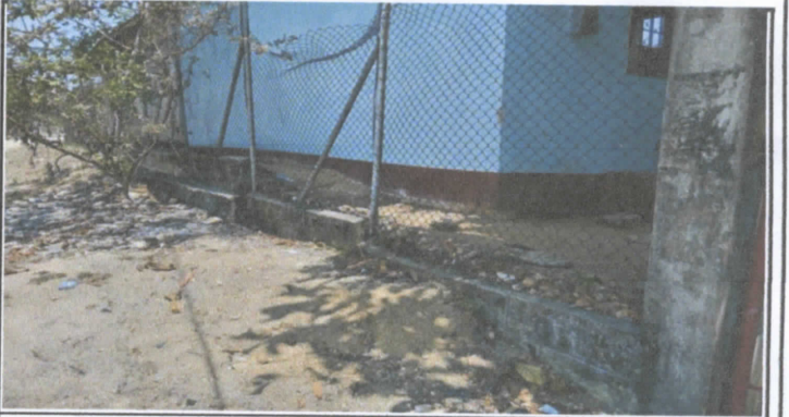
Reparación de muro perimetral de block con tubo hg y malla galvanizada, soleras intermedias y columnas