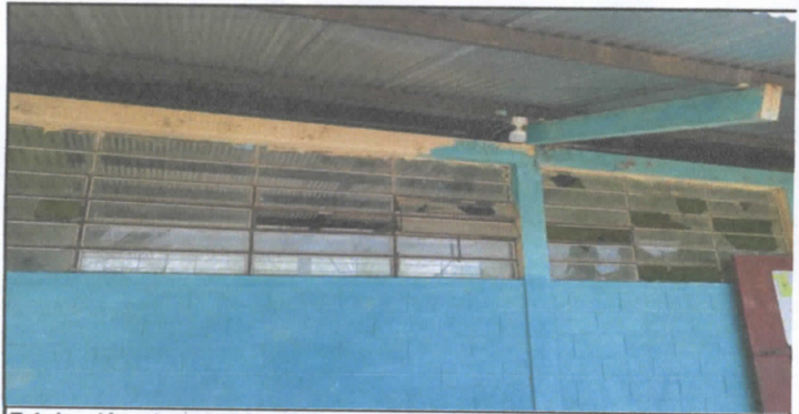
Fabricación e Instalación de ventana-balcon de metal