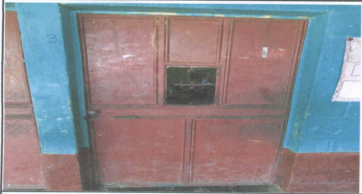
Sustitución de Puertas