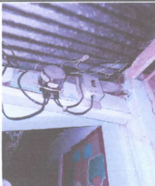
REPARACIÓN DE CABLEADO ELECTRICO