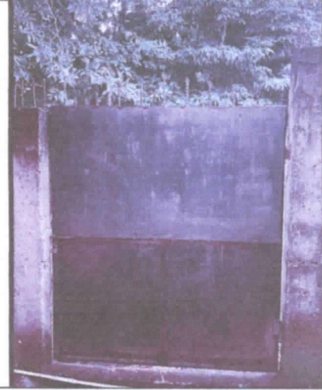
Puertas de metal a pintar ubicadas detrás de la escuela