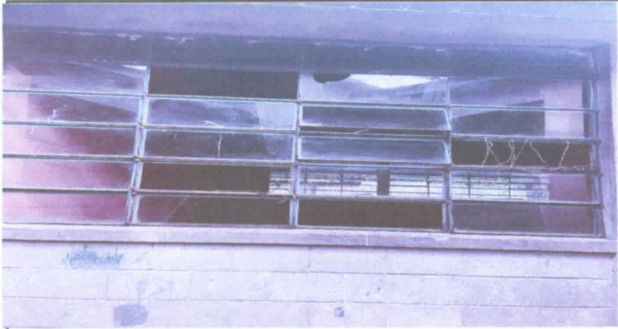
Ventanas en mal estado