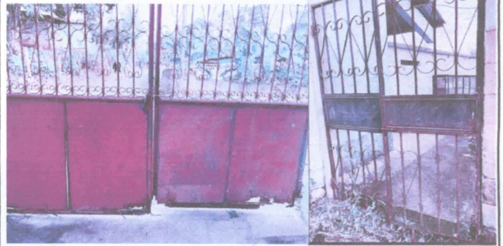
Portones para sustitución