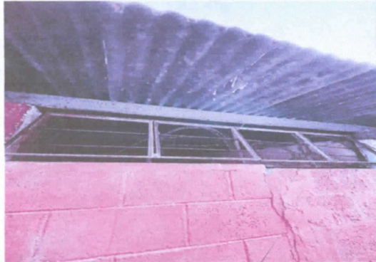
ventanales para reparación