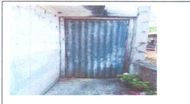
SUSTITUCIÓN DE PUERTA DE METAL