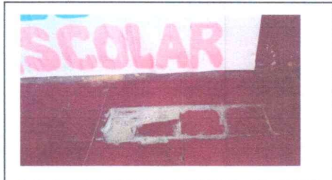
SUSTITUCION DE PISO DE CERAMICA DE GRANITO