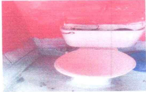
SERVICIO DE SANITARIO Y SUS ACCESORIOS