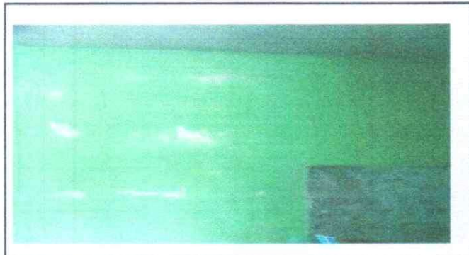
SUSTITUCIÓN DE ESTRUCTURA DE METAL DE VENTANA