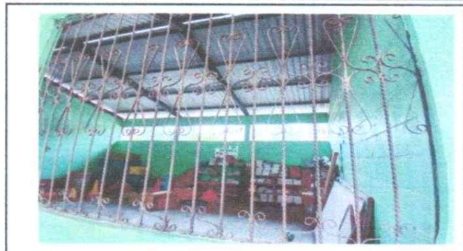
REPARACIÓN DE ESTRUCTURA DE METAL DE LA VENTANA