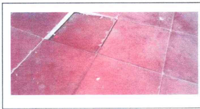
SUSTITUCIÓN DE PISO DE CERAMICA DE GRANITO