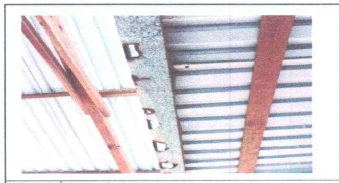
SUSTITUCIÓN DE CANAL DE METAL

Observación: Si es necesario se pueden agregar hojas adicionales y actualizar el número de hojas.