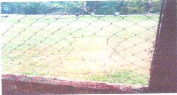
REPARACIÓN DE MALLA