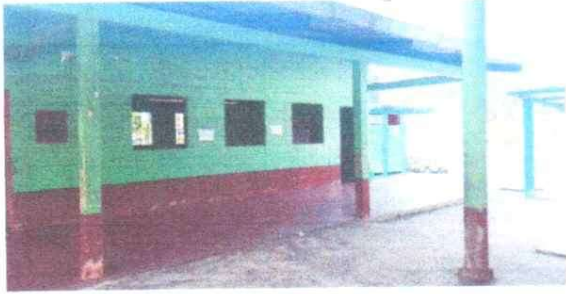
PINTURA DE EN MUROS EXTERIORES E INTERIORES