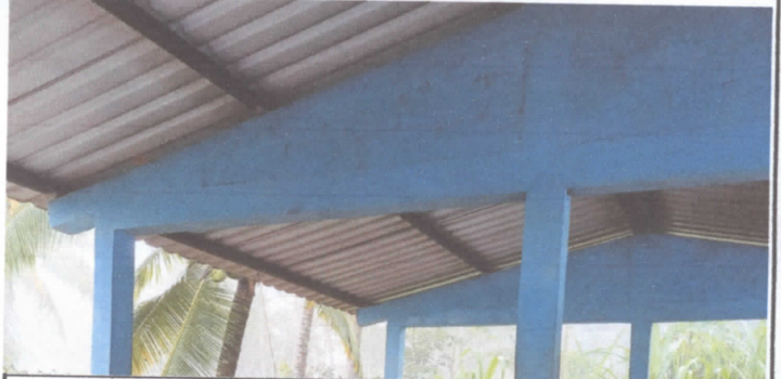
2.3 SUSTITUCION DE ESTRUCTURA DE SOPORTE DE METAL POR METAL