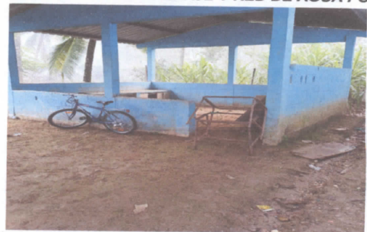
RED DE AGUA POTABLE. 14.9 SUSTITUCION DE TUBERIA DE LINEA PRINCIPAL.

Observación: Si es necesario se pueden agregar hojas adicionales y actualizar el número de hojas.