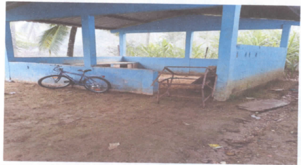
5.6 SUSTITUCION DE BALCONES DE METAL