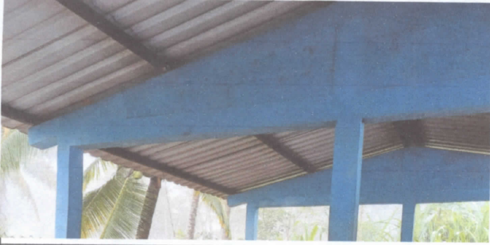
1.1 SUSTITUCION DE LAMINIA POR LAMINA TROQUELADA ALUZINC CALIBRE 26