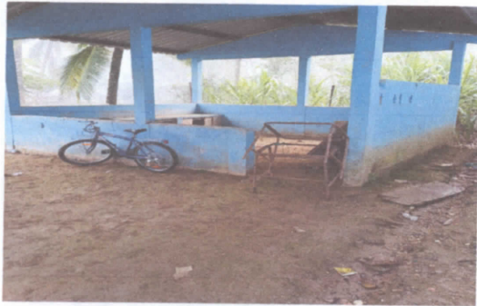
4.3 SUSTITUCION DE PUERTA