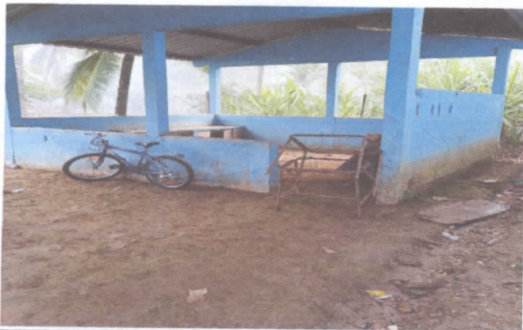
6.5 SUSTITUCION DE PISO DE TORTA DE CONCRETO