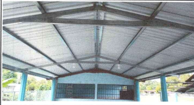
Foto1: Sustitución de estructura de Madera por metal