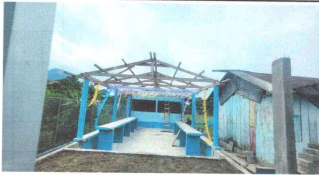
Foto1: Sustitución de estructura de Madera por metal