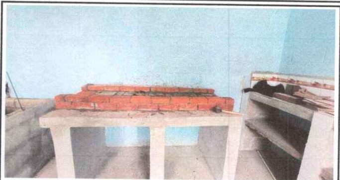
Foto 2: Sustitución de estufa rural completa incluye chimenea y plancha