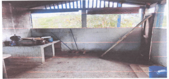
foto 2 sustitucion de piso de concreto por piso de granito