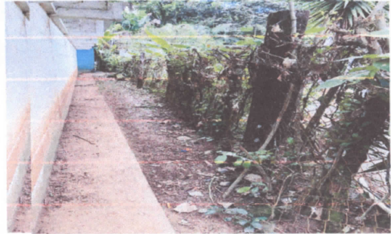
foto 4. construcción de muro perimetral de block.