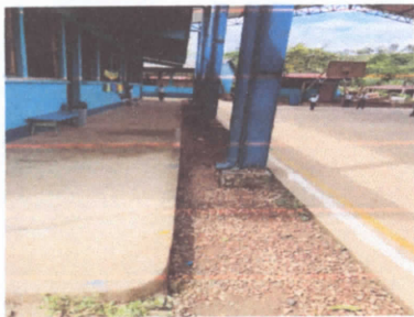
foto 5 sustitucion de piso de concreto por granito