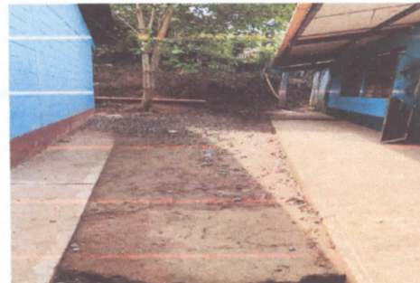
foto 6 reparacion por piso de granito

Observación: Si es necesario se pueden agregar hojas adicionales y actualizar el número de hojas.