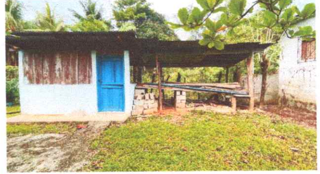
Foto 2: Reparación y ampliación de cocina, estructura metálica, ventanas y puerta, construcción de polletón, mesa y bancas de concreto, electricidad.