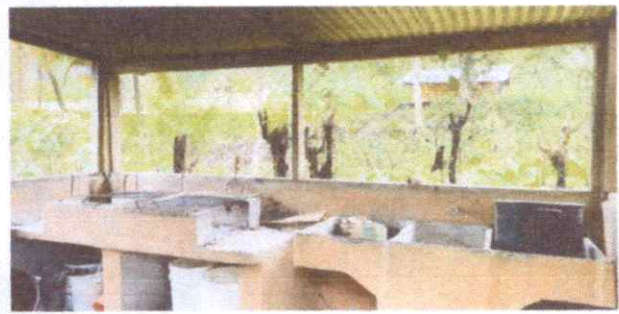
reparación de pared de fondo cocina