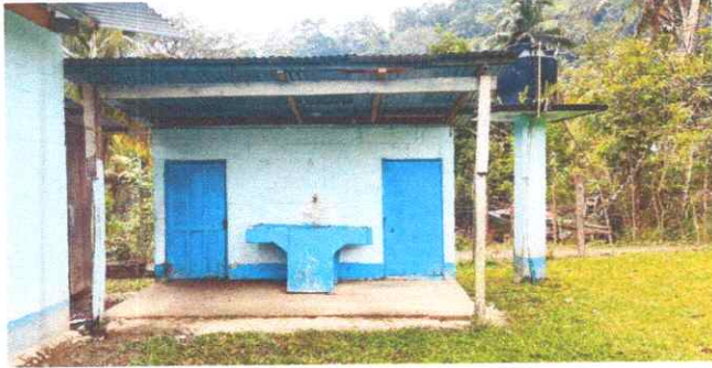
Foto 1: Reparación y ampliación de servicios sanitarios, sustitución de estructura metálica, drenajes, puertas, fosa séptica, pila y Rotoplas