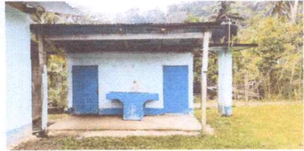
Reparación de puertas y traslado de pila