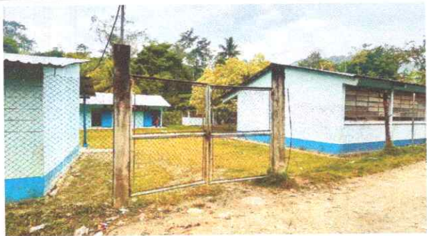
Foto 5 : Ampliación y reparación de portón principal del Establecimiento