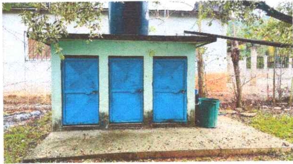
Foto 3: Reparación de servicios sanitarios, colocación de otro rotoplas, reparación de puertas, estructura metálica y techo de lámina.