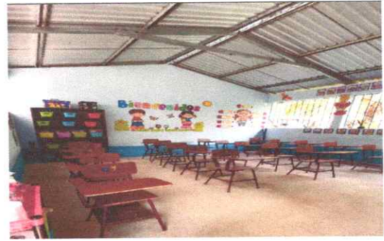
Foto 4: Instalación completa de energía eléctrica en dos salones de clases