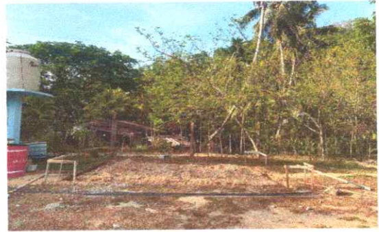
Foto 6: Construcción de escenario, estructura metálica y techo de lámina

Observación: Si es necesario se pueden agregar hojas adicionales y actualizar el número de hojas.