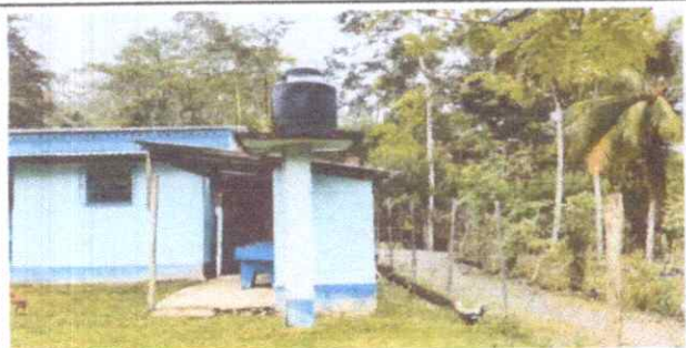
Reparación de lámina y estructura metálica