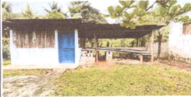
Ampliación y Reparación de techo de cocina