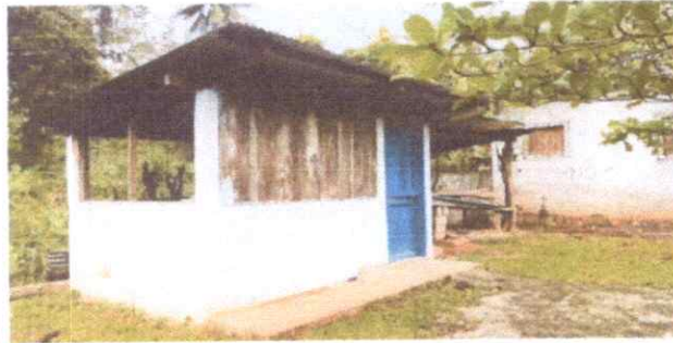
Reparación de puertas y ventanas