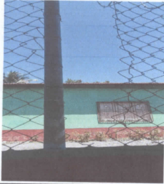
AREA DEL MURO PERIMETRAL DAÑADA, ESTA CORTADO EN VARIAS PARTES