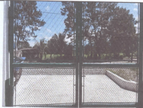
CON CHAPA, CAMBIA DE MAYA POR LAMINA .

Observación: Si es necesario se pueden agregar hojas adicionales y actualizar el número de hojas.