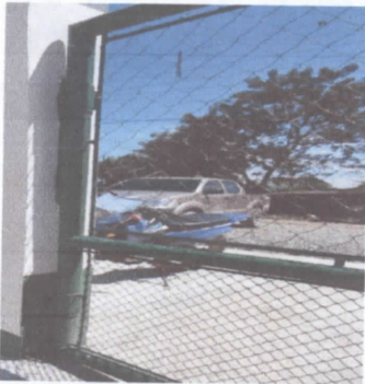
PORTON DEL ESTABLECIMIENTO NECESITA CUBRIRSE , CON LAMINA , PARA SEGURIDAD DE LOS ESTUDIANTES