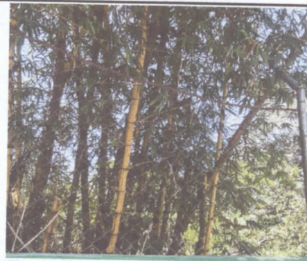
NECESITA LA MAYA, PINTADA, CAMBIO DE VARILLA.