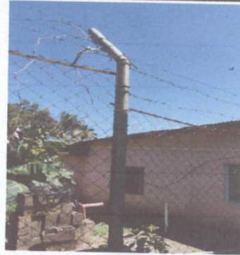
EL ALAMBRE ESTA OXIDADO, EL ALAMBRE DE PUA, OXIDADO Y CORTADO