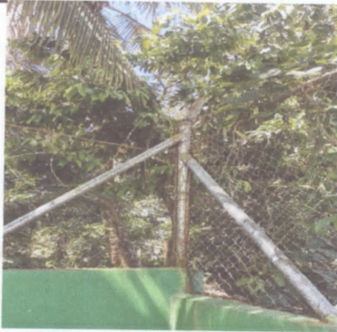
CAMBIO DE VARILLA EN EL MURO, SE ENCUENTRA OXIDADO, Y NECESITA PINTURA, PARA MAYOR DURACION