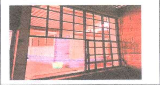
FOTO 2. SUSTITUCION DE BALCON