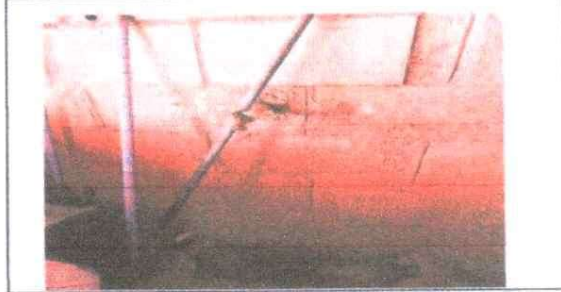
FOTO 6. MANTENIMIENTO EN AREA DE COCINA, COLOCACION DE AZULEJO

Observación: Si es necesario se pueden agregar hojas adicionales actualizando el número de hojas.