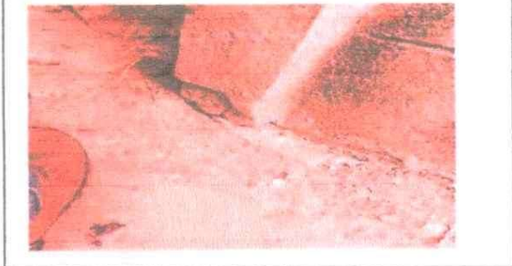
FOTO 4. MANTENIMIENTO DE CUNETETA DE CONCRETO