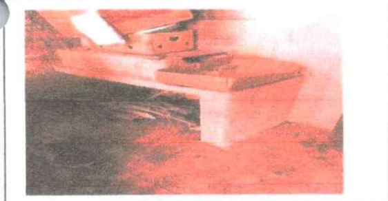
FOTO 3. SUSTITUCION DE TORTA DE CONCRETO