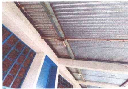
Foto 2: Reparación de sistema eléctrico, reparación de cableado eléctrico, sustitución de ducto eléctrico + accesorio