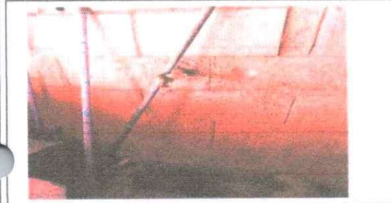
FOTO 5. MANTENIMIENTO DE PINTURA INTERIOR Y EXTERIOR, EN AREA DE COCINA