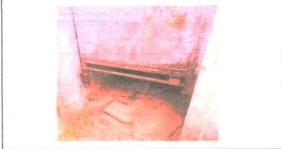
FOTO 1. MANTENIMIENTO DE PUERTA DE METAL