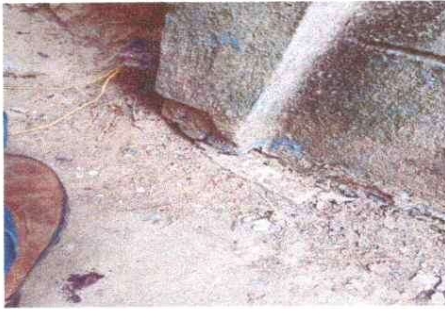
Foto 1: Reparación de drenajes, sustitución de tubería PVC, línea principal aguas servidas.