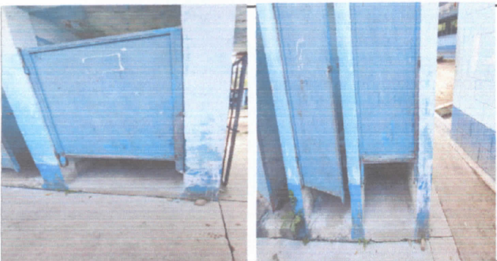
sustitucion de puertas en servicios sanitarios