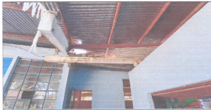
sustitucion de canal de pvc

Observación: Si es necesario se pueden agregar hojas adicionales y el número de hojas.