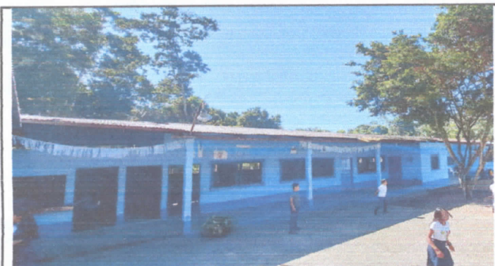
sustitucion de lamina, por lamina troquelada aluzic calibre 26