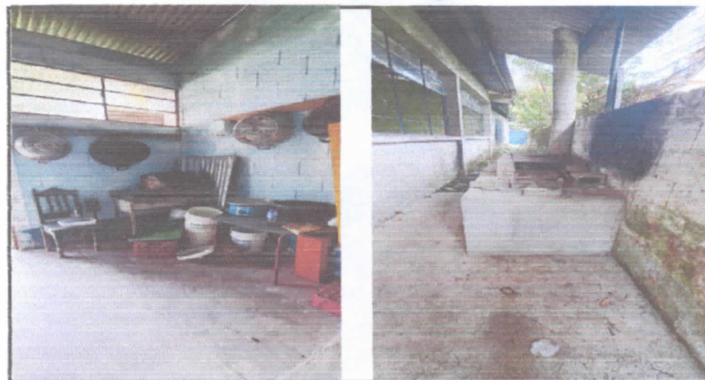
mantenimiento a estufa rural, réacion a muebles de cocina