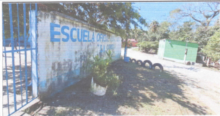
mantenimiento en pintura para paredes internas y externas del establecimiento.