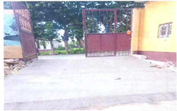
FOTO 6: Portón principal con rampa para el ingreso de vehículos al establecimiento.

Observación: Si es necesario se pueden agregar hojas adicionales y actualizar el número de hojas.