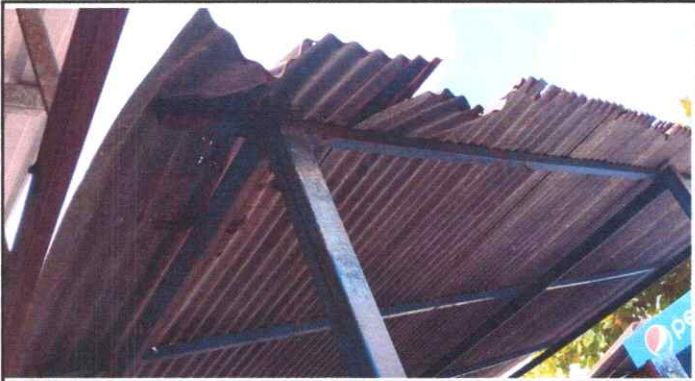
Reparación de Techo