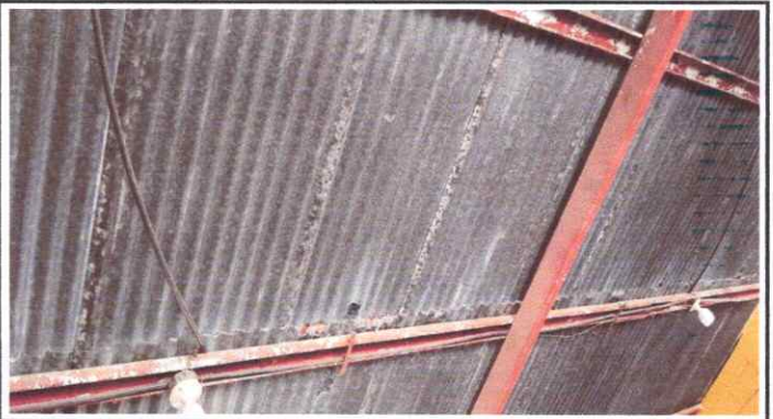
Cambio de Costaneras