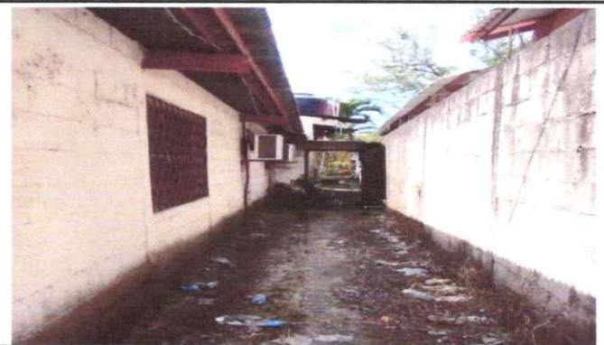
Levantado de paredes