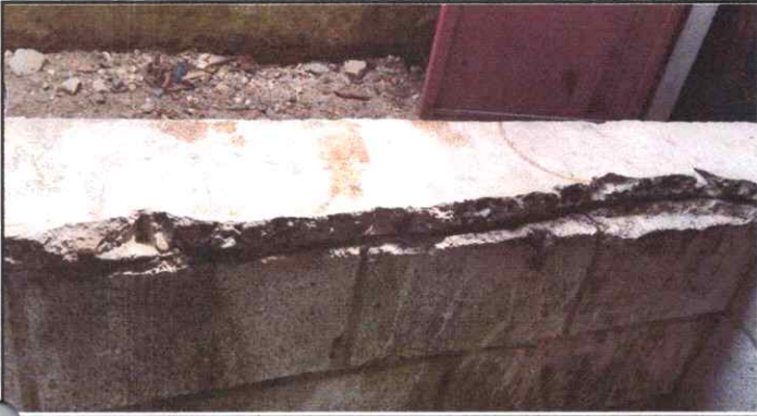
Reparación de pasamano