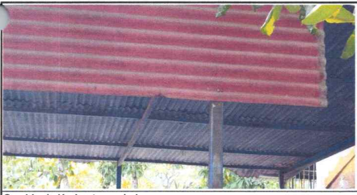
Cambio de lámina troquelada