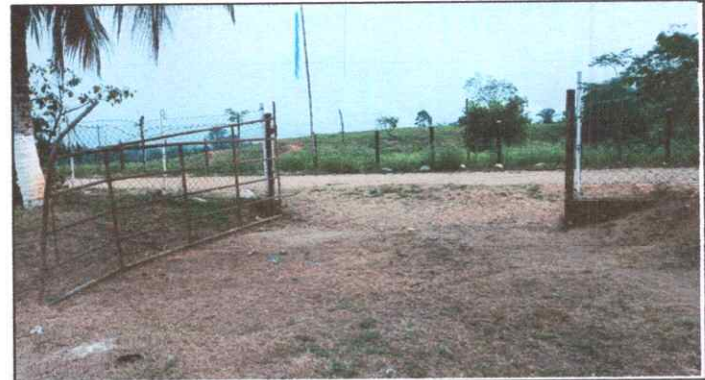
Foto 4: REPARACIÓN DE MURO PERIMETRAL DE BLOCK CON TUBO HG Y MALLA GALVANIZADA