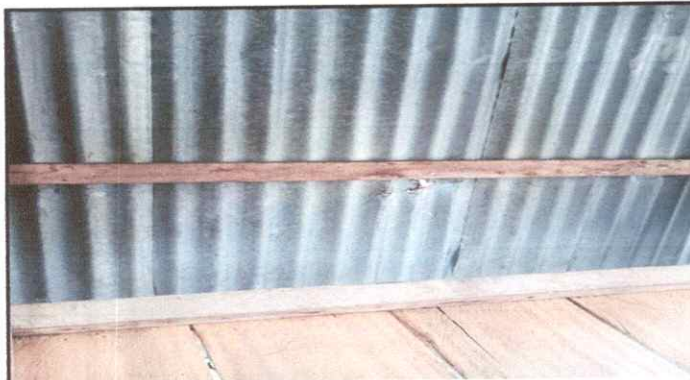
Foto 3: SUSTITUCIÓN DE LÁMINA, POR LÁMINA TROQUELADA ALUZINC CALIBRE 26 PIES