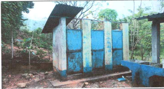
Foto 1: MANTENIMIENTO A ESTRUCTURA (LIJADO, CAMBIO DE TUBO, CEPILLADO, SUJECIONES, APLICACIÓN DE PINTURA) A PUERTA DE SERVICIOS SANITARIOS